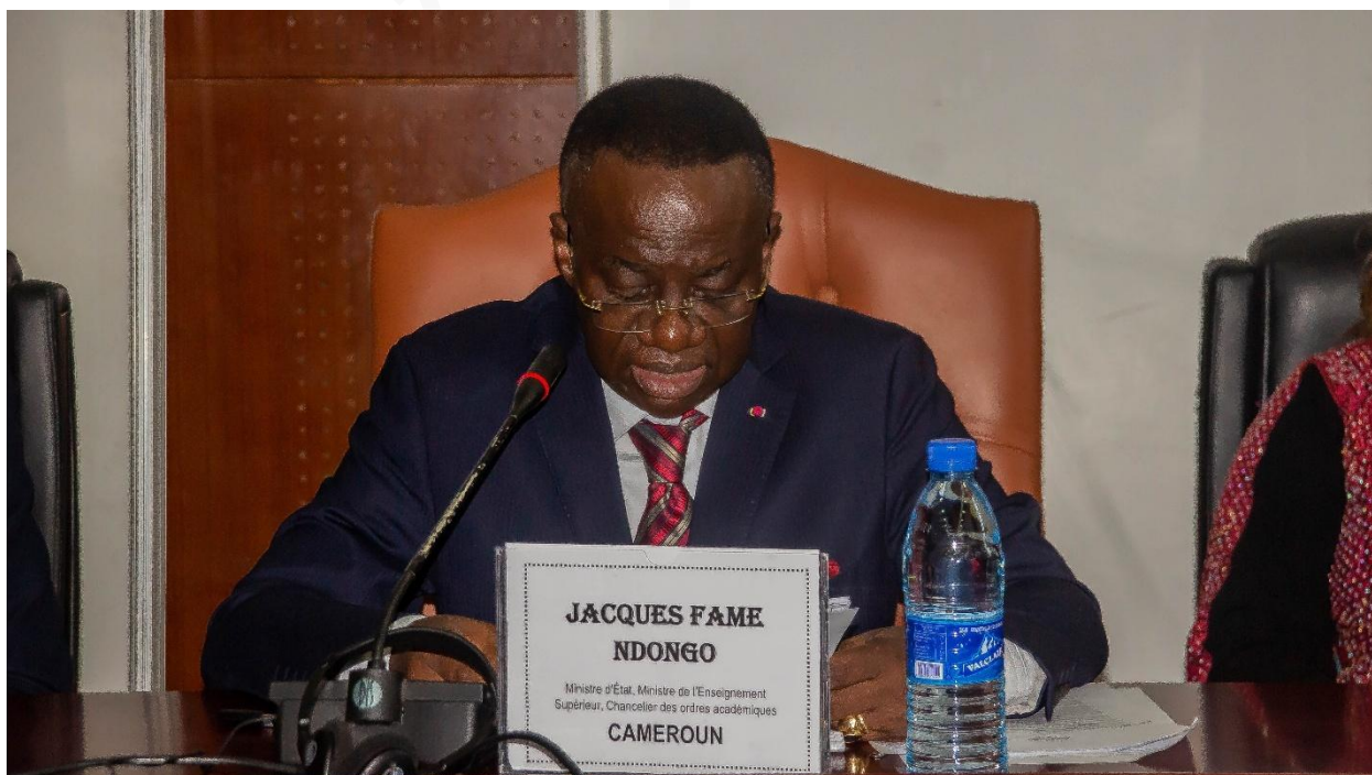
Professeur Jacques FAME NDONGO, Ministre d'Etat, Ministre de l'Enseignement Supérieur, Chancelier des Ordres Académiques